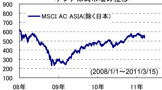
<アジア株式市場の推移>

足元で市場が落ち着きを取り戻せば、リスク資産への資金還流が再び起こることにより株価は反発し、その後も緩やかながら上昇すると思われます。